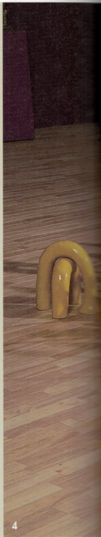
6 KICB 젊은작가상 장 카이 Zhang Kai(중국) 「브라유에 바치는 헌사 Tribute to Braille」 180×35×15cm | 자기점토, 1250°C | 2020